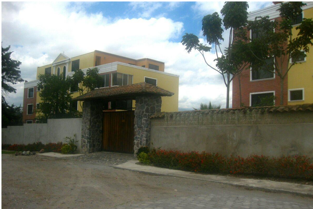
F12: Tamia Quilumbaquí