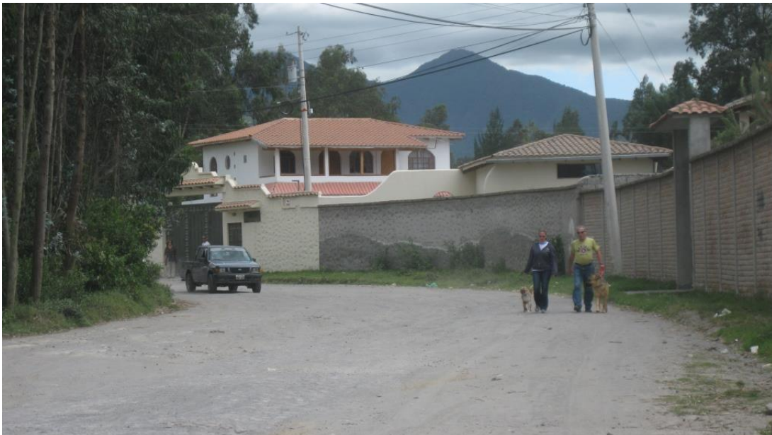
F8: Tamia Quilumbaquí