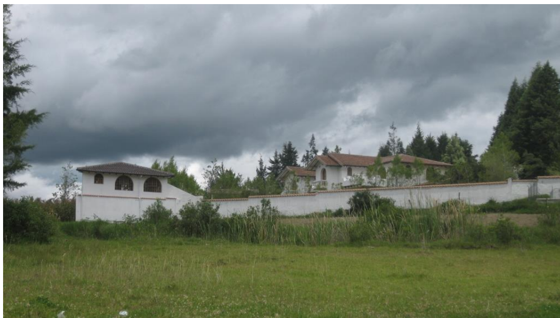
F5: Conjunto, comunidad de El Batán. Tamia Quilumbaquí