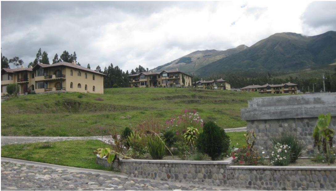
F3: Casas en Hahua Pacha.

Condominios en los alrededores de la comunidad de El Batán