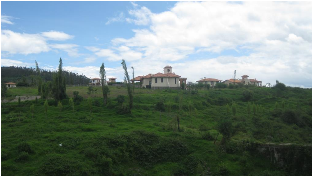
F4: Tamia Quilumbaquí

Condominios en los alrededores de la comunidad de El Batán