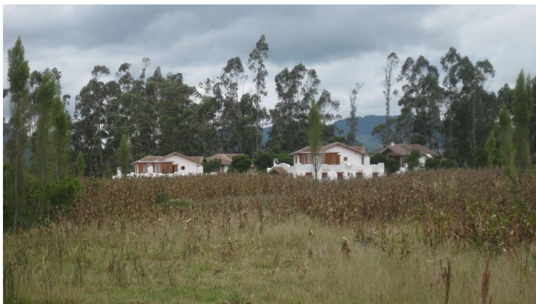
F6: Conjunto, comunidad El Batán. Tamia Quilumbaquí