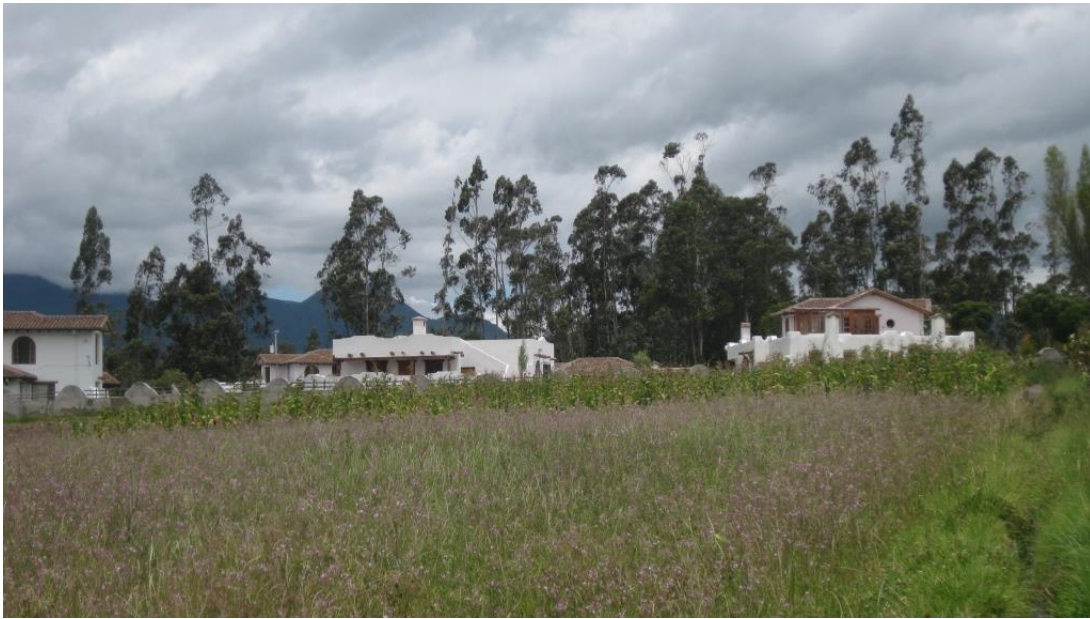
F7: Vista desde campos de cultivo, Conjunto habitacional en la comunidad de El Batán. Tamia Quilumbaquí