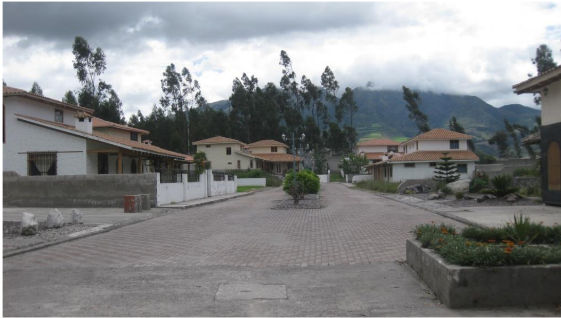
F9: Interior, Rumi Tola. Tamia Quilumbaquí