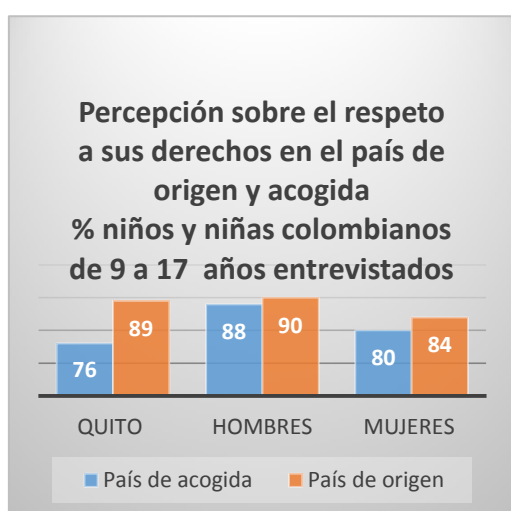
Ilustración 1 Fuente: ODNA – MIES-INFA – UNICEF 2009