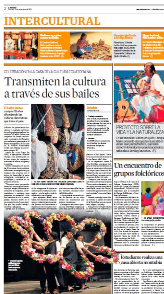
Artículos de diario El Universo “Transmiten la cultura a través de sus bailes” y “Proyecto sobre la vida y la naturaleza” en la página Intercultural.

Para mejor legibilidad, el texto completo de cada artículo puede ser encontrado en el