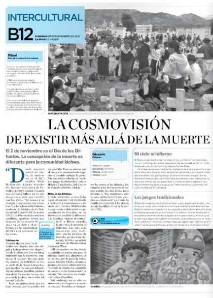
Artículo de diario La Hora “La Cosmovisión de existir más allá de la muerte”