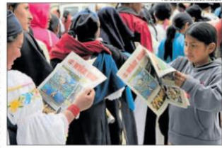
Distintas generaciones muestran su interés por esta publicación.

Los temas de producción son los que más espacio se llevan, pues a través de ellos también se habla sobre las