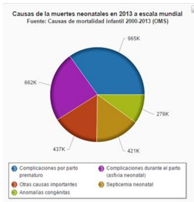
Gráfico 1 Causas de muertes neonatales en 2013

La Organización Mundial de la salud, en la asamblea mundial sobre la salud (OMS, 2010, pag.2), determinó que cada año 276.000 recién nacidos fallecen durante las primeras cuatro semanas de vida en el mundo debido a anomalías congénitas, a nivel mundial representa el 7% de muertes de recién nacidos. A continuación, se explican las cifras.