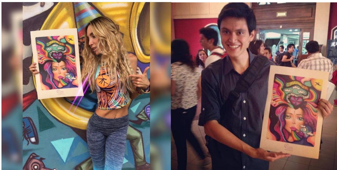
Gráfico 4 Promoción producto comunicacional