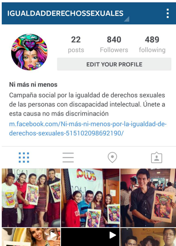
Gráfico 10 Estadísticas Instagram