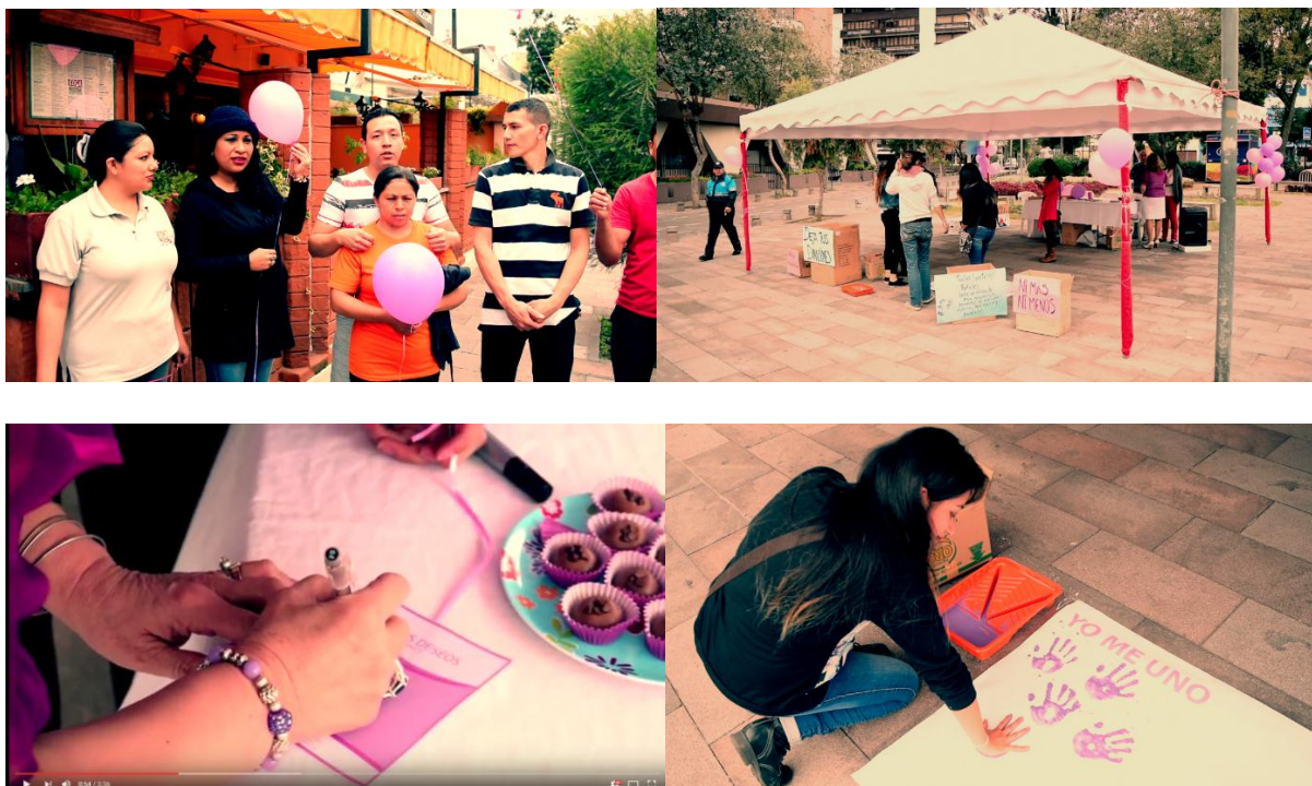
Gráfico 5 Registro de activación 24 de abril 2016