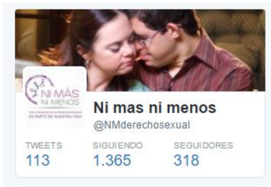
Gráfico 9 Estadística Twitter

de participación ciudadana. También organizaciones feministas como Igualdad YA, Violencia de género TD, entre otros.