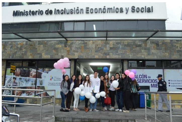
Gráfico 7 Registro activismo 2 de mayo