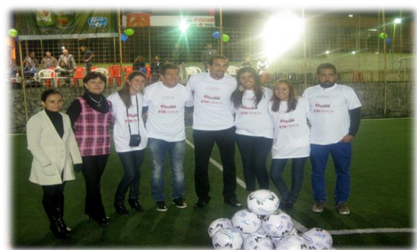
7. Imágenes del Evento final