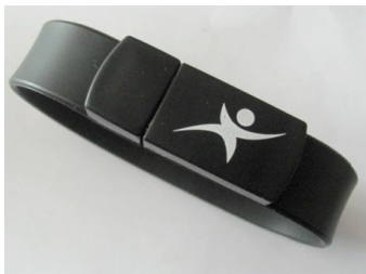
1. Imagen pulsera

El brazalete al contener un USB, podrá ser utilizado por los deportistas para guardar su información personal y de emergencia, en caso de accidente. Dicho USB podrá ser conectado dentro de una ambulación, centro de salud, u hospital cercano; facilitando al personal la información para el tratamiento del paciente.