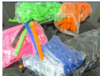
2. Imagen producto