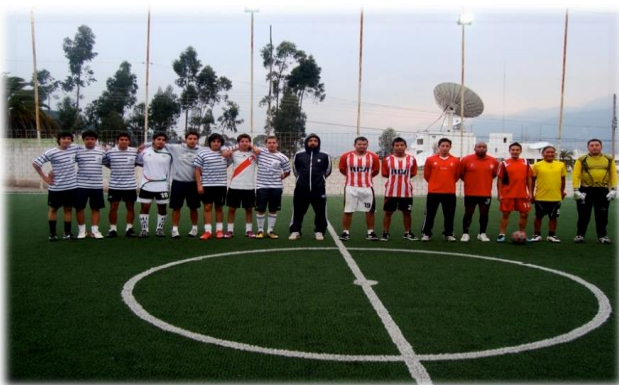
6. Imagen de los equipos finalistas

Los equipos fueron Bayú, Kimberley Clark, Café Rojo y FutbolCity. El campeón del cuadrangular fue el equipo de la universidad San Francisco Bayú.