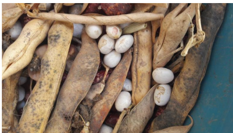
Frejol Bola Blanca