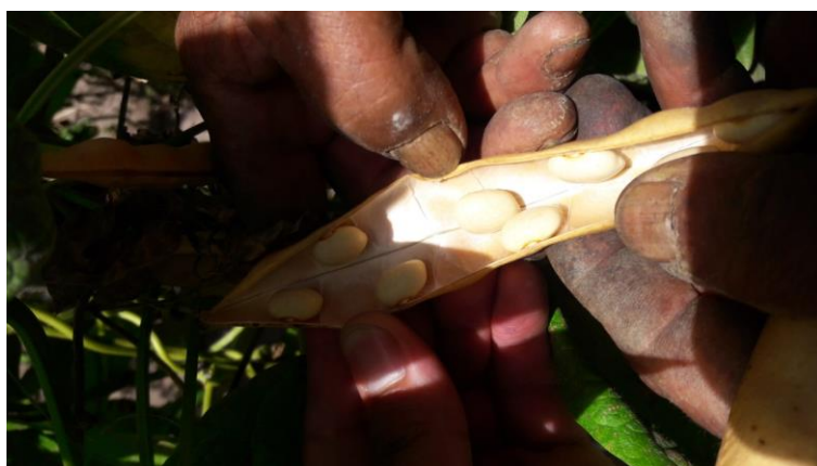
Frejol Canario, variedad de 6 meses