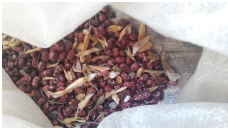
Frejol Bola Roja