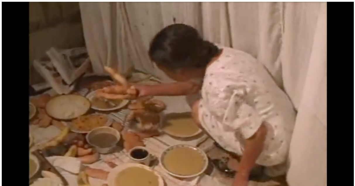
[Figura 1. Captura de pantalla de la película: ‘De cuando la muerte nos visitó’.]

El largometraje documental de Yanara Guayasamín ‘De cuando la muerte nos visitó’ fue inspirador, puesto que abarca el tema del enfrentamiento a la muerte partiendo de una experiencia personal, pero extrapolada a las costumbres y ritos que se desenvuelven en un poblado en la Península de Santa Elena – Ecuador. A pesar de que filma con un modo performativo sus experiencias de lo que para ella significa la muerte, la relación con mi proyecto radica en la manera que retrata la celebración en la Costa Ecuatoriana, a través de una actitud de aprendizaje frente a lo que está observando y lo que descubre de esa cosmovisión. Por lo que analizar esa aproximación de “directora-personajes” me fue de gran provecho.