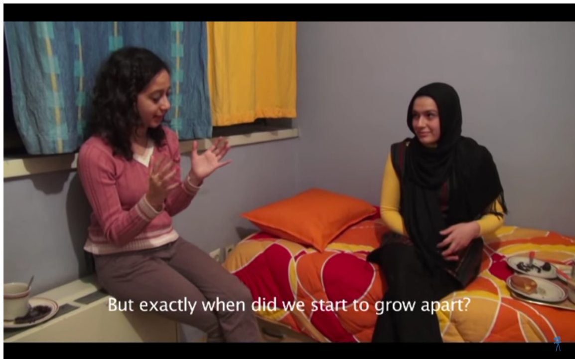
[Figura 3. Captura de pantalla de la película: 'Fest of Duty'.]

Y a pesar del tiempo tan limitado para la producción de mi tesis, considero que fue clave haber compartido – en la etapa de pre-producción– la cotidianidad con la gente a la que iba a retratar, puesto que me dio la apertura necesaria para indagar en el tema y poder retratar momentos delicados como el luto en espacios tan personales, por ejemplo, el dormitorio donde dejaban en vela los alimentos.