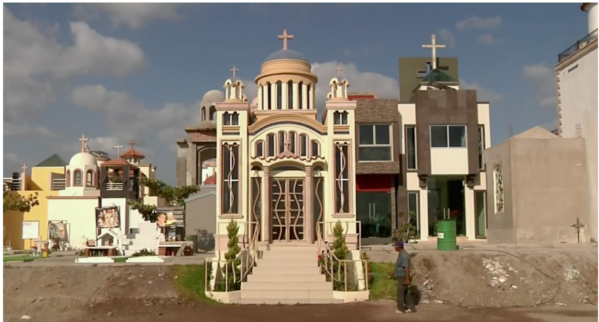
[Figura 2. Captura de pantalla de la película: ‘El Velador’.]

También poseo un profundo interés por el largometraje documental ‘El Velador’ de Natalia Almada. Éste capta imágenes poéticas que observan respetuosamente las rutinas diarias de la gente que pasa día y noche entre los ostentosos mausoleos de Sinaloa. Si bien, la película retrata los problemas socio-económicos por la narcoviolencia en México, los recursos que utiliza son imágenes contemplativas sin narración o voice-off explicativo. En relación a la ejecución de mi tesis, este ha sido un material muy valioso como ejemplo del modo observacional.