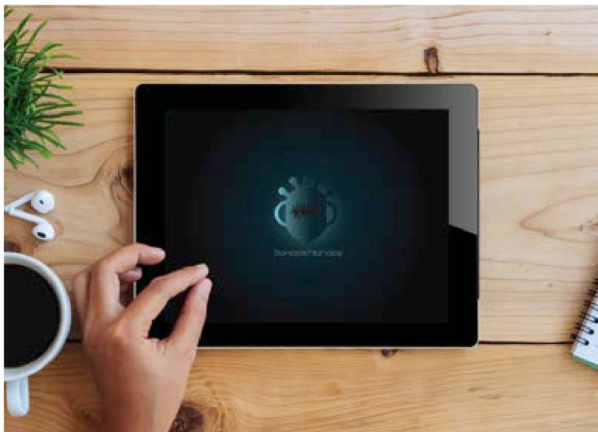
Aplicación Sonidos Híbridos

podrán encontrar la música de su preferencia ya que por medio de las secciones de la Aplicación se clasificará al gusto de cada receptor.