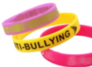
Figura 5. Pulsera de silicón

Se elaborará una pulsera de silicón brandeada con el logo de la campaña Break the bullying, esta será promocionada en los CAVS e islas de Netlife de atención al cliente a nivel nacional, un total de 29 puntos y tendrá el valor de $1.