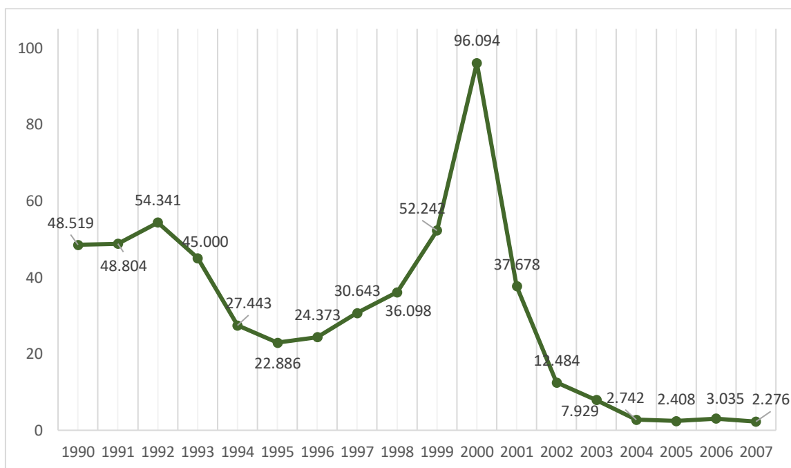
Gráfico 2: Inflación en Ecuador 1992-2006 (% Anual)

Gráfico 1. En 1992, con la elección de Sixto Durán-Ballén como presidente, Ecuador entró de lleno a ser un país que seguía una ideología neoliberal, en cuanto al manejo de su economía. Se creía que para un país en vías de desarrollo este tipo de políticas económicas era la única forma de conseguir un crecimiento de calidad (Hidalgo 2016). En dichos años se establecieron leyes inadecuadas para intentar manejar la inflación, en temas como “modernización del sector público que implicaba restarle poder al Estado en el control de áreas estratégicas y abrirse a un programa de privatizaciones, según las directrices del FMI y los organismos internacionales” (Hidalgo 2016), es decir que, en el gobierno ecuatoriano prevalecía una política de apertura externa y liberalización del mercado.