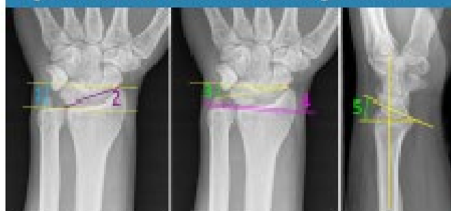
1. Altura Radial (mm), 2. Inclinación Radial (°), 3. Ángulo Bistiloides (°), 4. Varianza Ulnar (mm), 5. Inclinación Volar (°)