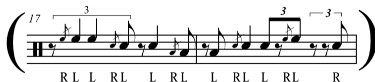
Figura 4. Perspectivas Up-Beats Quarter Note Triplets, Solo de Max Roach en el tema Jordy del álbum Clifford Brown & Max Roach .

Perspectiva Up-beats tresillo de negra (UQNT).