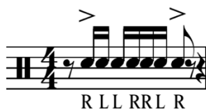
Figura 5. Lick de Max Roach en el tema Jordy del álbum Clifford Brown & Max Roach .

En el compás trece, Max Roach realiza un lick.