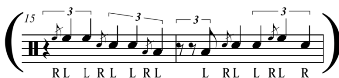
Figura 3. Perspectivas Quarter Note Triplets, Solo de Max Roach en el tema Jordy del álbum Clifford Brown & Max Roach .

Perspectiva Up-beats tresillo de negra (UQNT).