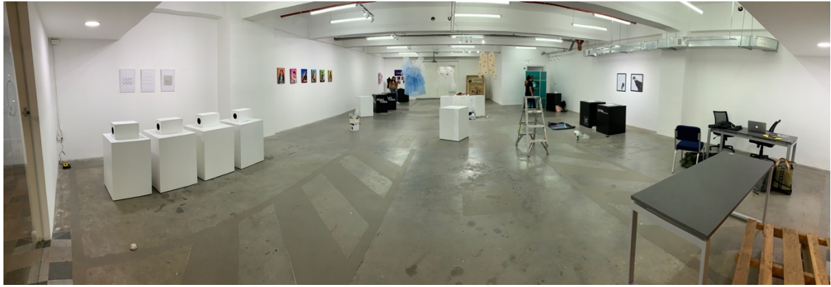
Anexo 28 Espacio de exposición