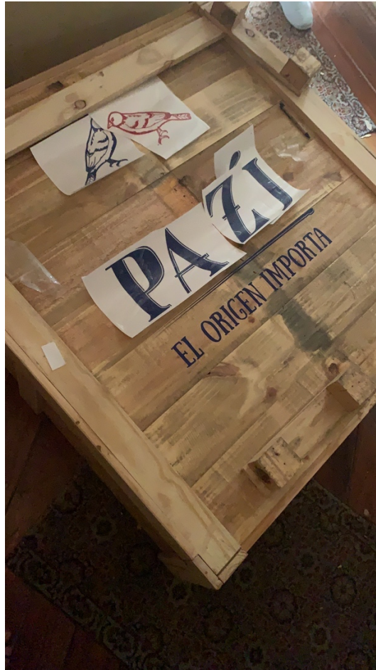
Anexo 18 Branding Bar