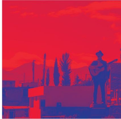
Anexo 13 Menú Creencias interno 2