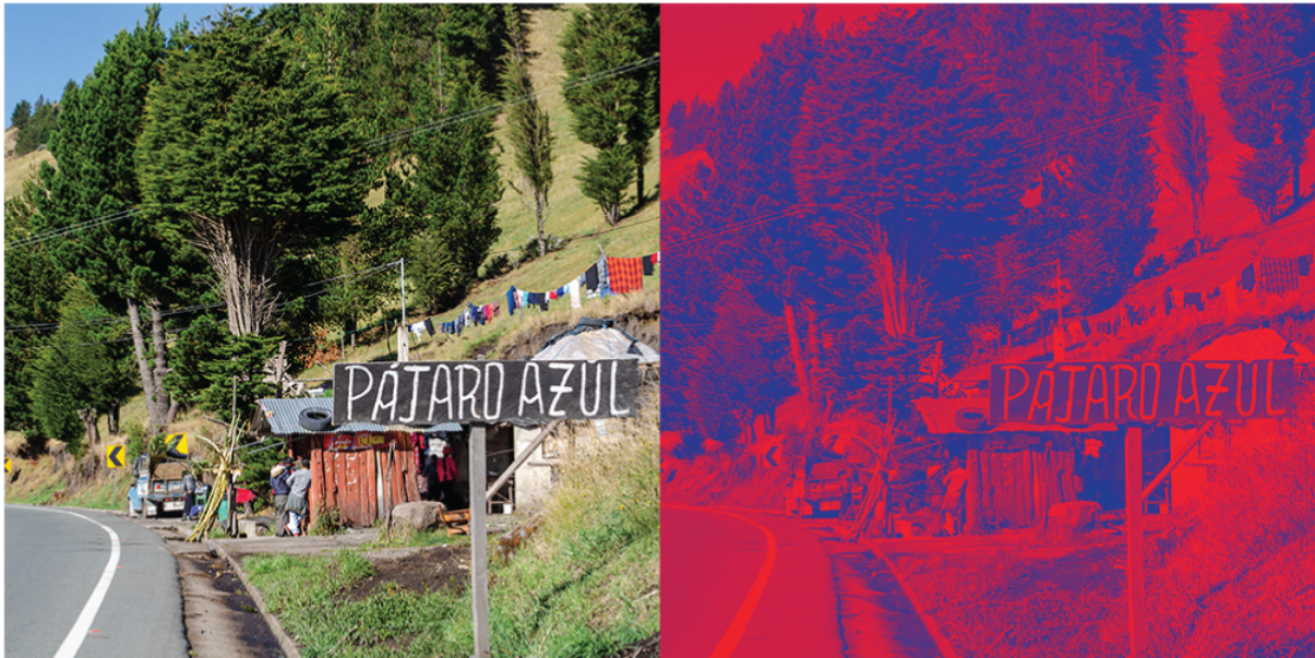
Figura 8 Tratamiento a fotografías

Dentro de la exhibición se planteo la posibilidad de que el consumidor pueda acercarse al puesto de exposición que fue construido para asemejarse a un bar, elegir un menú y pedir las opciones propuestas para saborear y vivir de manera presencial con un pequeño ejemplo de lo elegido.