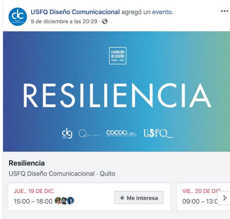
Anexo 20 Promoción en Facebook