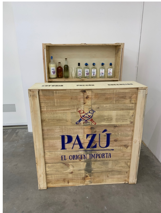
Anexo 19 Bar final