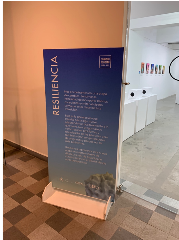
Anexo 22 Totem Resiliencia