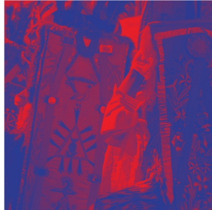
Anexo 8 Menú Pregón interno 2