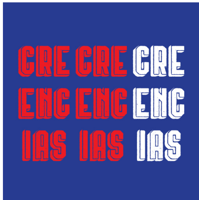
Anexo 11 Menú Creencias portada