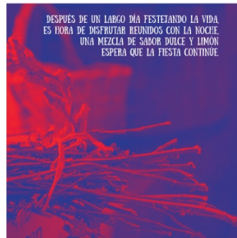
Anexo 9 Menú Pregón interno 3