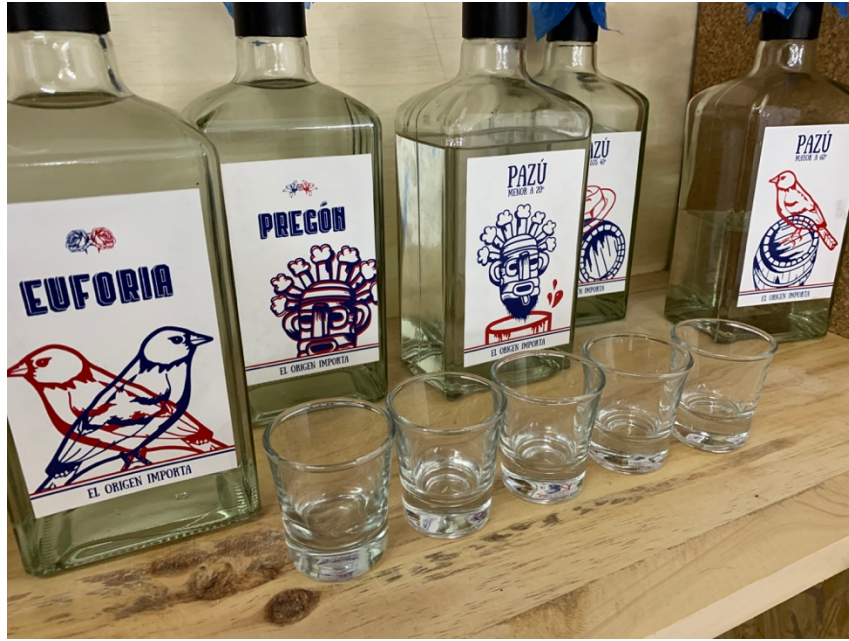
Anexo 24 Botellas bar