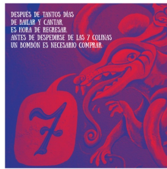
Anexo 10 Menú Pregón interno 4