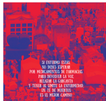
Anexo 2 Menú Euforia interno 1