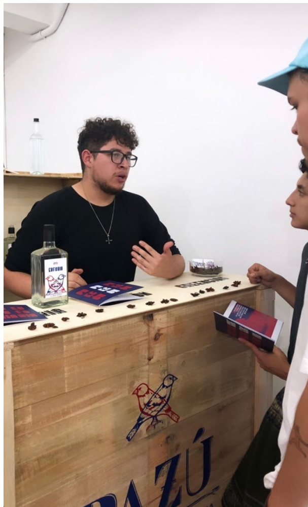
Anexo 25 Exposición de proyecto