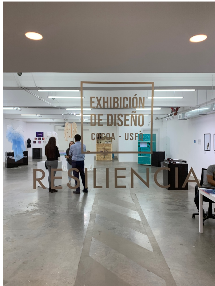
Anexo 29 Identidad de la exhibición