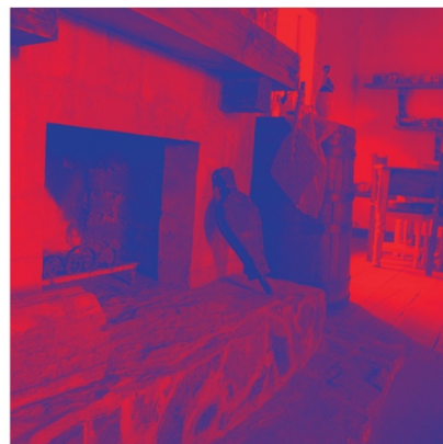
Anexo 3 Menú Euforia interno 2