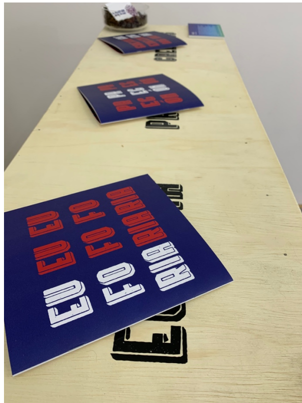
Anexo 23 Distribución menús