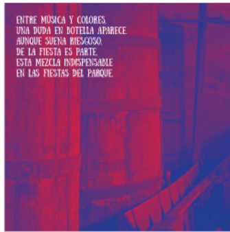
Anexo 7 Menú Pregón interno 1