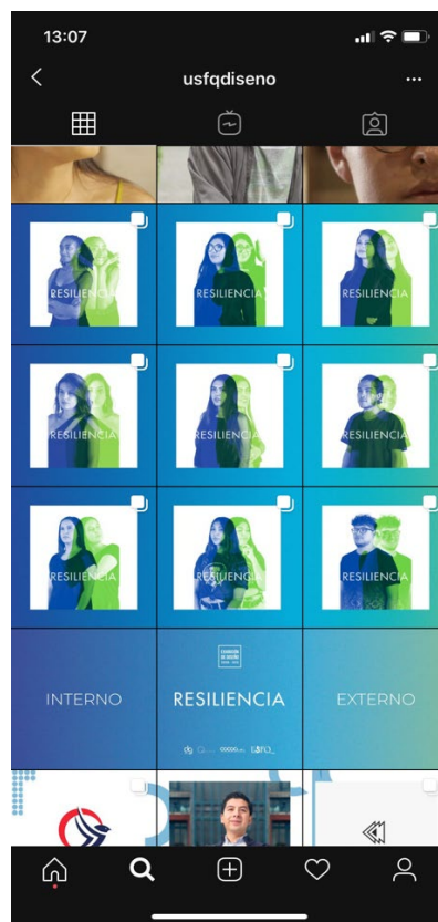
Anexo 21 Promoción Instagram