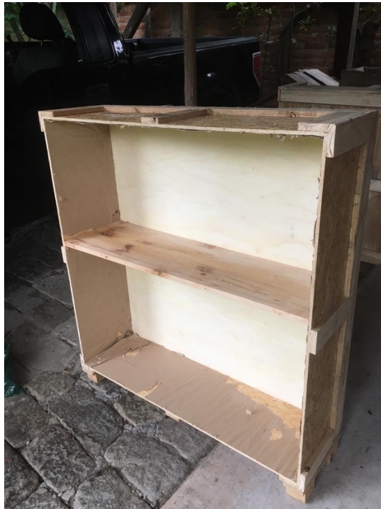
Anexo 17 Estantería Bar