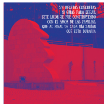
Anexo 12 Menú Creencias interno 1