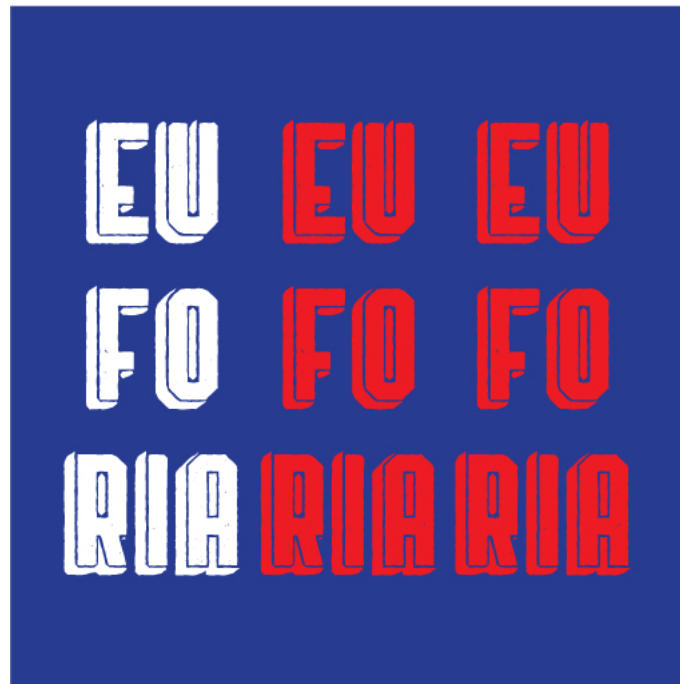
Anexo 1 Menú Euforia portada