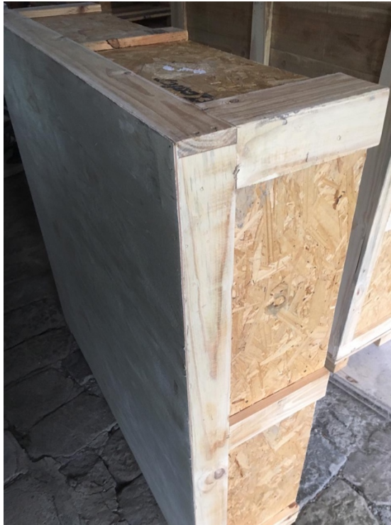
Anexo 16 Construcción bar