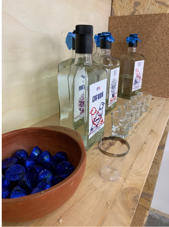
Anexo 30 Distribución de elementos