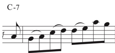
Figura 6. Compás 15 transcripción. Noche Criolla. Elaboración propia.

Luego Salvador en el compás 15 adopta otro recurso que es el recurso escalar pentatónico (ver fig. 6).