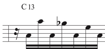
Figura 2. Compás 4 transcripción. Teen Town. Elaboración propia.

En los compases 2 y 3 es fácil darse cuenta del recurso cromático para ir a una nota del acorde, utilizando como manejo rítmico a las corcheas y silencio de corcheas (ver fig. 3).