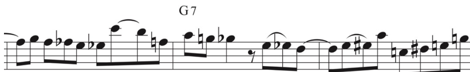
Figura 5. Compás 10, 11 y 12 transcripción. Noche Criolla. Elaboración propia.

En los compases 10, 11 y 12 se puede apreciar claramente de nuevo el uso del cromatismo como aproximación y también se introduce por primera vez el uso del tresillo para enriquecer rítmicamente al solo (ver fig. 5).