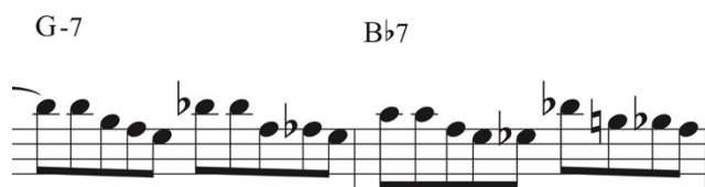
Figura 8. Compás 18 y 19 transcripción. Noche Criolla. Elaboración propia.

Luego llega al clímax del solo por medio de aproximaciones cromáticas al compás 19, en donde se formarán patrones rítmicos que se componen de dos corcheas y tres tresillos de corchea, hasta llegar al compás 20 (ver fig. 8), donde regresa al patrón rítmico de corcheas para llegar a los compases 22 y 23 (ver fig. 9), donde el movimiento melódico adopta nuevamente el recurso del cromatismo hasta llegar al compás 24, en donde Salvador por medio del recurso escalar y adoptando el patrón rítmico del tresillo utiliza un escala mixolidia comenzando desde la décima hasta su raíz.