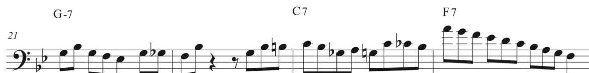
Figura 9. Compás 21, 22, 23 y 24 transcripción. Noche Criolla. Elaboración propia.

Al llegar al compás 25, claramente se puede apreciar el fin de la sección clímax del solo, y por medio de un arpeggio comienza el descenso del solo hasta llegar al compás 28, en donde luego de un recurso escalar, utiliza una armonización entre Eb y Bb para llegar al compás 29, en donde aplicará el mismo recurso en el beat cuatro y así culminar con el solo de Salvador Cuevas (ver fig. 10).