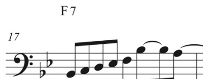
Figura 7. Compás 17 transcripción. Noche Criolla. Elaboración propia.

Luego llega al clímax del solo por medio de aproximaciones cromáticas al compás 19, en donde se formarán patrones rítmicos que se componen de dos corcheas y tres tresillos de corchea, hasta llegar al compás 20 (ver fig. 8), donde regresa al patrón rítmico de corcheas para llegar a los compases 22 y 23 (ver fig. 9), donde el movimiento melódico adopta nuevamente el recurso del cromatismo hasta llegar al compás 24, en donde Salvador por medio del recurso escalar y adoptando el patrón rítmico del tresillo utiliza un escala mixolidia comenzando desde la décima hasta su raíz.