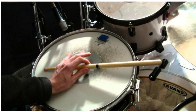
Figura 4. Técnica de ejecución cross stick .

Desde el compás 18 (figura 3), Blakey nos muestra frases que reciclan los contenidos de los compases 10 y en adelante, a modo de repetición, llegando al compás 25 donde se presenta un nuevo material basado en el uso de cross stick , que es una manera de tocar el snare con el borde ancho de la baqueta (figura 4), obteniendo un sonido hueco acompañado del timbre de la madera de la baqueta y del metal que compone el aro de la caja (Anónimo, 2019), que se repite y genera una sensación rítmica muy refrescante.