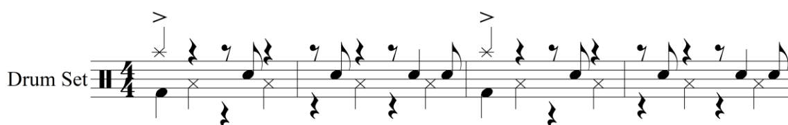
Figura 1. Primeros cuatro compases del solo de Art Blakey en Sincerely Diana .

El solo de batería compuesto por Art Blakey en el tema Sincerely Diana de Wayne Shorter (1960) tiene una estructura de 76 compases. Es un solo desarrollado exclusivamente para redoblante. Se puede observar que en los primeros compases del solo (figura 1) predomina un acento en el tiempo uno, que es ejecutado con bombo y crash que apertura el solo con una densidad rítmica simple, para dar paso a estructuras rítmicas más complejas que suponen un nivel de ejecución elevado.