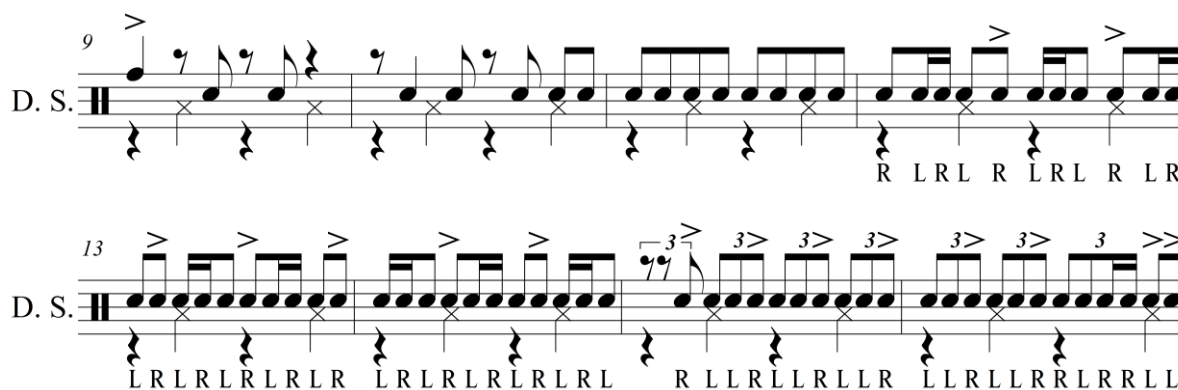
Figura 2. Compas 12 y siguientes.

A partir del compás 7, se encuentra una idea rítmica de dos compases propuesta en tresillos de corchea, que es la antesala a los motivos que Art Blakey presentará a lo largo de todo el solo. Las frases rítmicas, que el baterista propone a partir del compás 12 (figura 2), son ejecutadas haciendo uso de un concepto muy utilizado en batería conocido como sticking , el cual, es un proceso en el que el baterista asigna con qué mano tocar una nota pudiendo ser derecha, notado como R ( Right ) o izquierda, notado como L ( Left ), que tiene por objetivo garantizar una ejecución impecable (DasGupta, 2016).