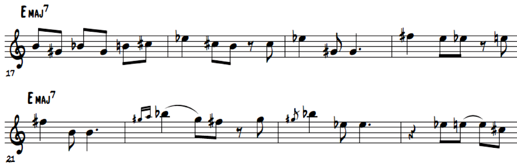
Figura 3. Ocho compases sobre Emaj7.

En el jazz tradicional los guitarristas tenían influencias directas del blues y del rag time. Del rag time por ser un género musical sincopado (acentos en tiempos débiles) y del blues porque incorpora la guitarra eléctrica a finales de 1930 (Palmer, 1965). Ambos géneros muy populares a finales de 1890 debido a las nuevas editoras musicales en los Estados Unidos (Library of Congress, s/f).