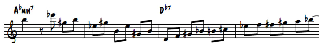
Figura 2. Triada menor por quintas.

En ese solo, también existen influencias de estudios clásicos. Esto es notable en la parte final, ya que utiliza un arpeggio de triada menor tocado por quintas (ver fig. 2). Tocar las triadas en 3ras o 5tas es común en las obras de Johann Sebastian Bach y otros compositores de esa época.