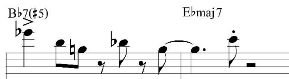
Figura 14. Frase de cierre.

Finalmente se da lugar a la parte resolutive del solo a partir del compás 60, siendo la presentación de un motivo que se desplaza descendentemente de forma cromática para aprovechar el desarrollo armónico, logrando así el uso gradual de chordtones que, apoyados por el uso de figuras rítmicas que se repiten, secundan la etapa de resolución sin dejar de mantener rapidez en su evolución, la cual culmina aprovechando la cadencia V-I que aparece en la sección C para crear una frase que sirve como cierre a esta parte del solo (fig. 14).