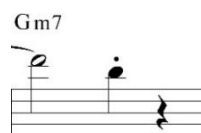
Figura 4. Compás once.

La primera etapa de tensión resulta interesante ya que Baker utiliza una serie de “falsas” conclusiones, evidentes en los compases once (fig. 4), catorce (fig. 5) y dieciséis (fig. 6), en las que se aprecia la realización de pequeñas secuencias melódicas, mismas que contienen una gran cantidad de tensiones, seguidas por pequeños silencios que acentúan una efímera sensación conclusiva, sin embargo, debido a la brevedad de las mismas, estas actúan como breves respiros que ayudan a mantener y desarrollar incertidumbre en la frase.