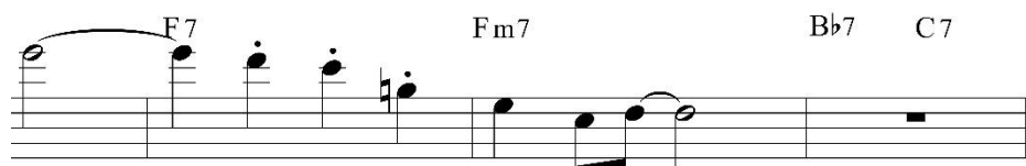
Figura 10. Frase conclusiva que parte del compás cuarenta y cinco.

En esta etapa destaca el aprovechamiento melódico de la armonía, ya que se emplea el continuo uso de patrones cadenciales 5 y acordes estables para incrementar el uso de tensiones dentro de un suave fraseo, además de breves chordtones a modo de reposo, con lo que se mantiene la leve tensión en el desarrollo. Finalmente, la sección B concluye a partir del compás 45, ya que, con el aumento de tensiones en compases anteriores, se logra dar paso a la resolución de la frase en raíz, además de un compás de respiro para dar lugar a la siguiente etapa del solo (fig. 10).