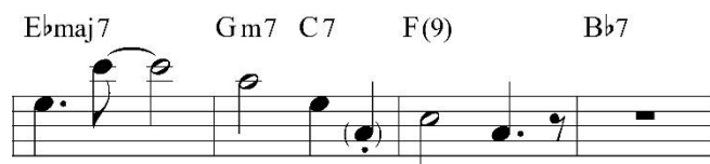
Figura 7. Frase resolutiva que parte del compás diecinueve.

Para culminar esta parte del solo, Baker realiza un desarrollo melódico que se percibe como resolutivo, ya que en el compás diecinueve realiza una frase de cuatro compases (fig. 7), en la que gracias al aprovechamiento de la armonía por medio de chordtones , la culminación de la frase en notas de mayor duración y un compás de descanso, enfatiza finalmente una sólida resolución a modo de reposo.