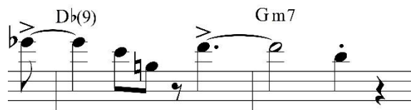
Figura 3. Frase de apertura para la etapa de tensión.

dando paso al desarrollo de la etapa de tensión, debido a que sus notas objetivo son la 11 en el caso de Re bemol mayor y de la 7 en el caso de Sol menor (fig. 3).