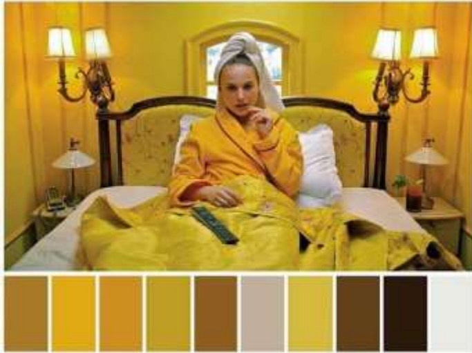
Ilustración 5. Paleta de colores referencial