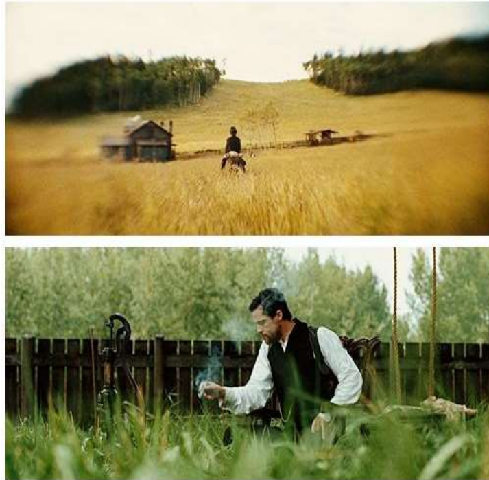
Ilustración 3. Referencia visual