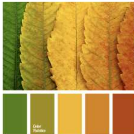
[Figura 10. propuesta de color]