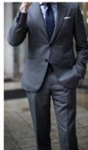
[Figura 15. propuesta de color]