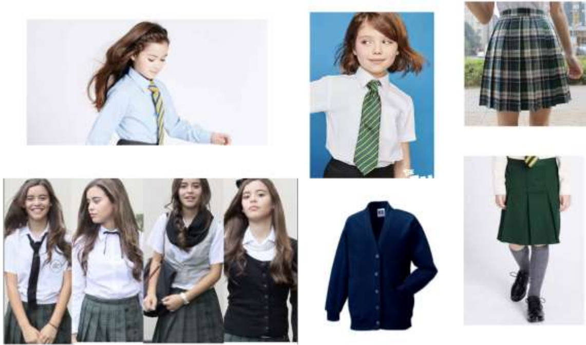
[Figura 13. propuesta de vestuario]