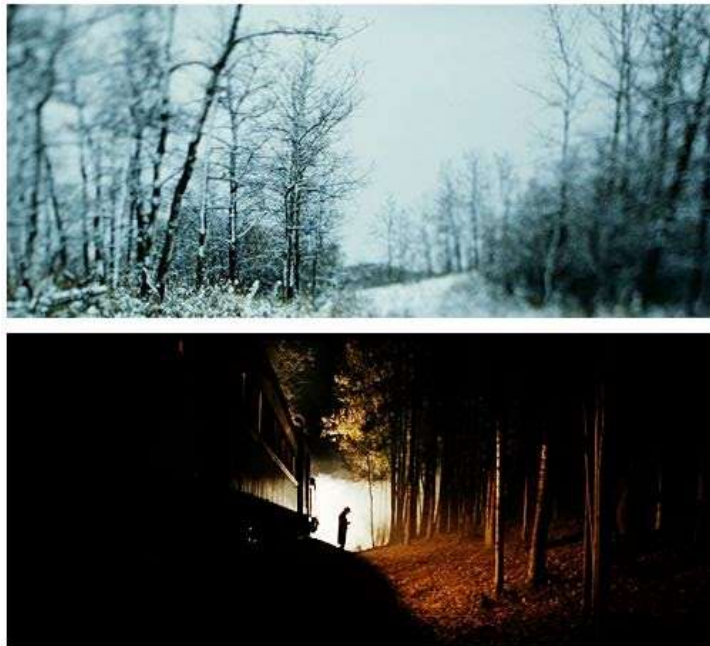
Ilustración 2. Referencia visual

Mientras el personaje principal de Julieta está en un proceso de entendimiento, duda e inestabilidad de entender su vida. Queremos mediante la fotografía dejar a un lado todos esos conceptos preestablecidos, mostrando la vida de ella sin extremos desde el lado de cámara e iluminación.