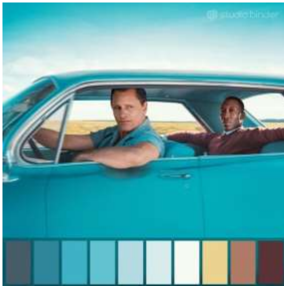
Ilustración 6. Paleta de colores referencial