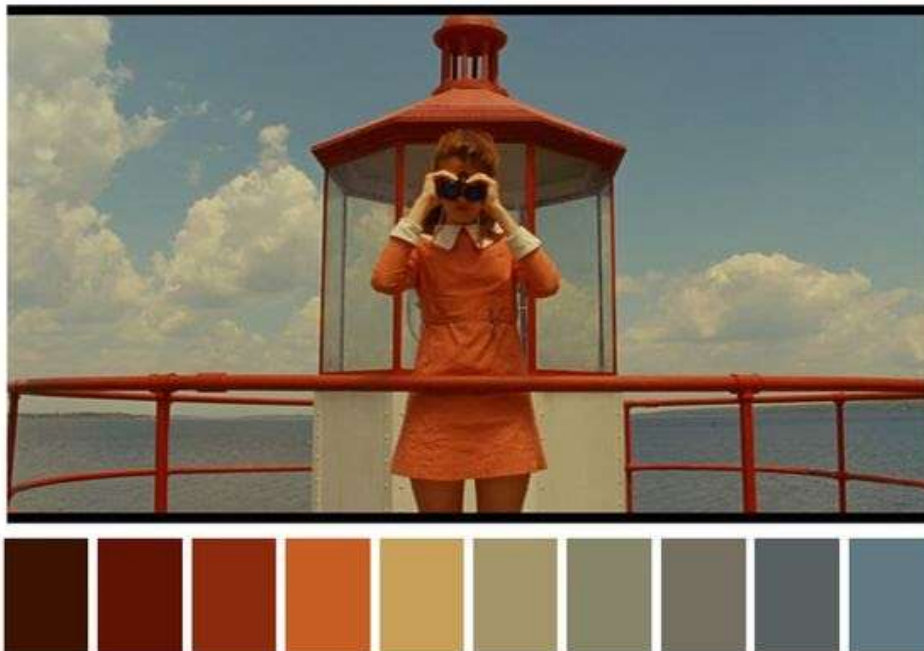
Ilustración 4. Paleta de colores referencial