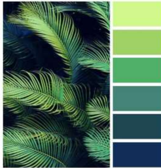
[Figura 11. propuesta de vestuario y paleta]