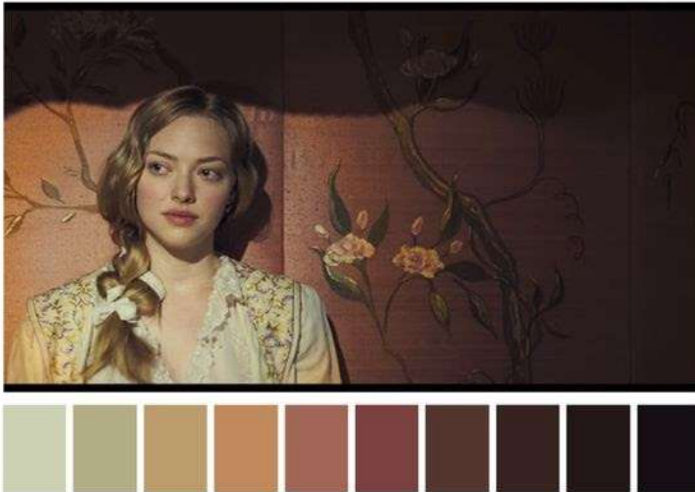
Ilustración 7. Referencia paleta