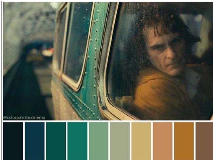
Ilustración 8. Referencia paleta