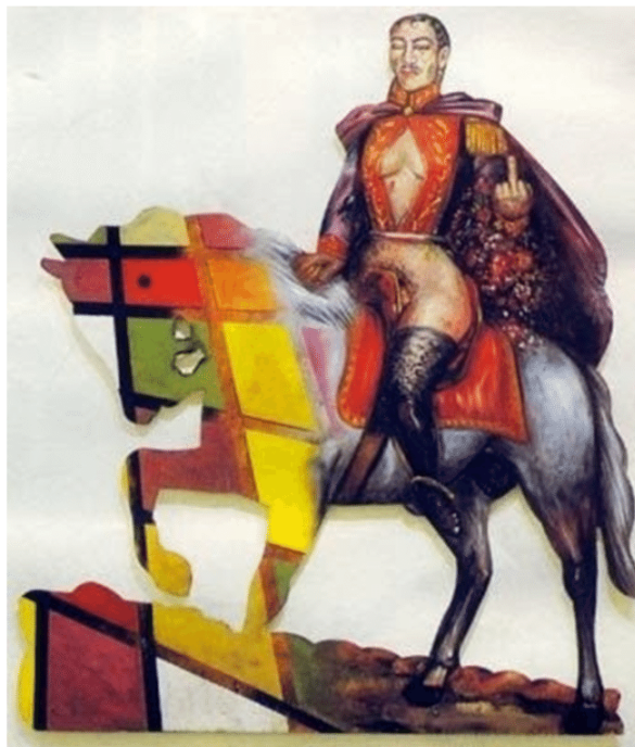
Figure 2. "El Libertador Simón Bolívar"- Juan Domingo Ávila (1994)

De esta manera, no es difícil imaginar cómo alguien puede cuestionarse estas imágenes y su impacto en una sociedad abandonada. Un claro ejemplo es el trabajo de Juan Domingo Dávila, quien pintó a Simón Bolívar, de una manera no convencional, lo demostró con senos femeninos, con rasgos indígenas y realizando un gesto obsceno al observador, todo mientras cabalga un corcel que desborda de la realidad, haciendo un eje al desborde de la realidad que se mantiene cada día mediante las elocuencias, historias y mitos de la sociedad.