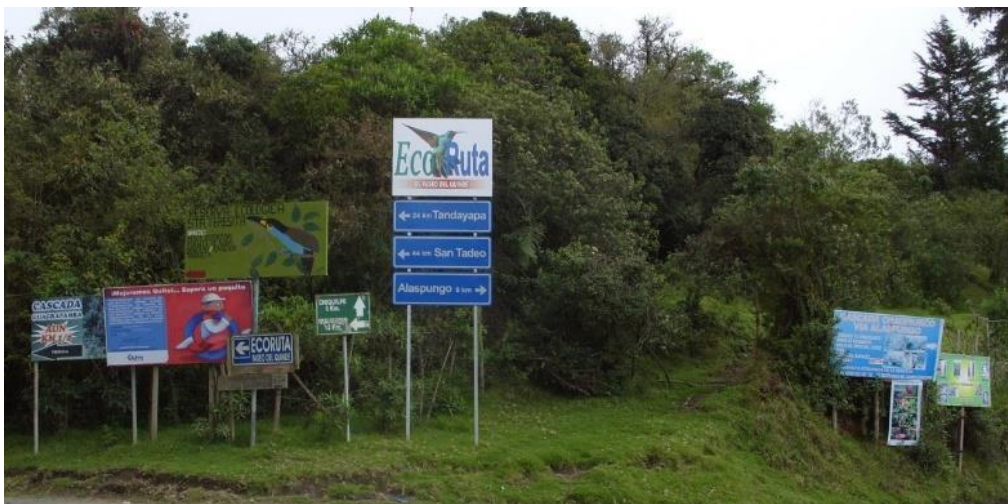
Figura 10: Eco ruta del Quinde