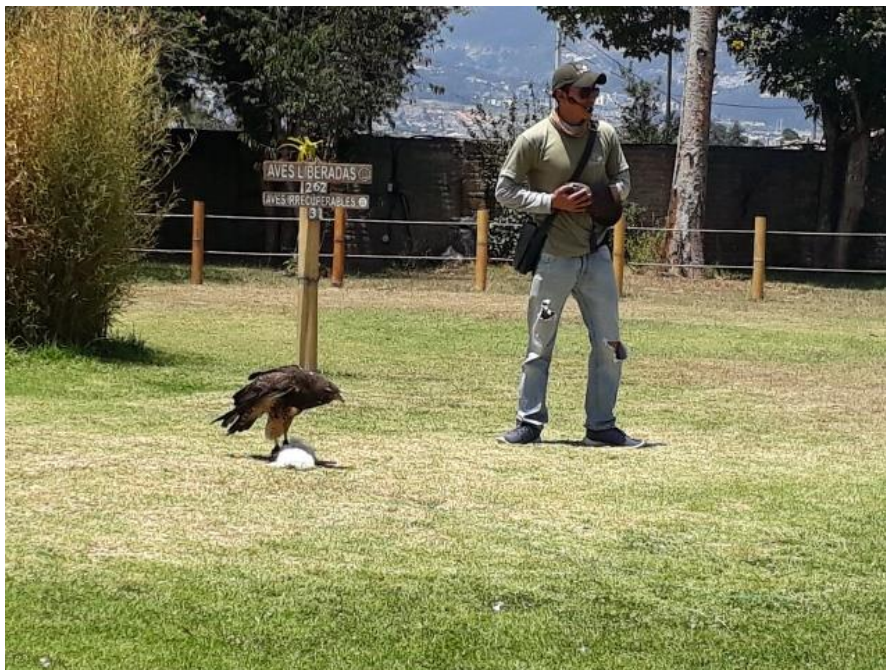
Figura 4: El jardín Alado