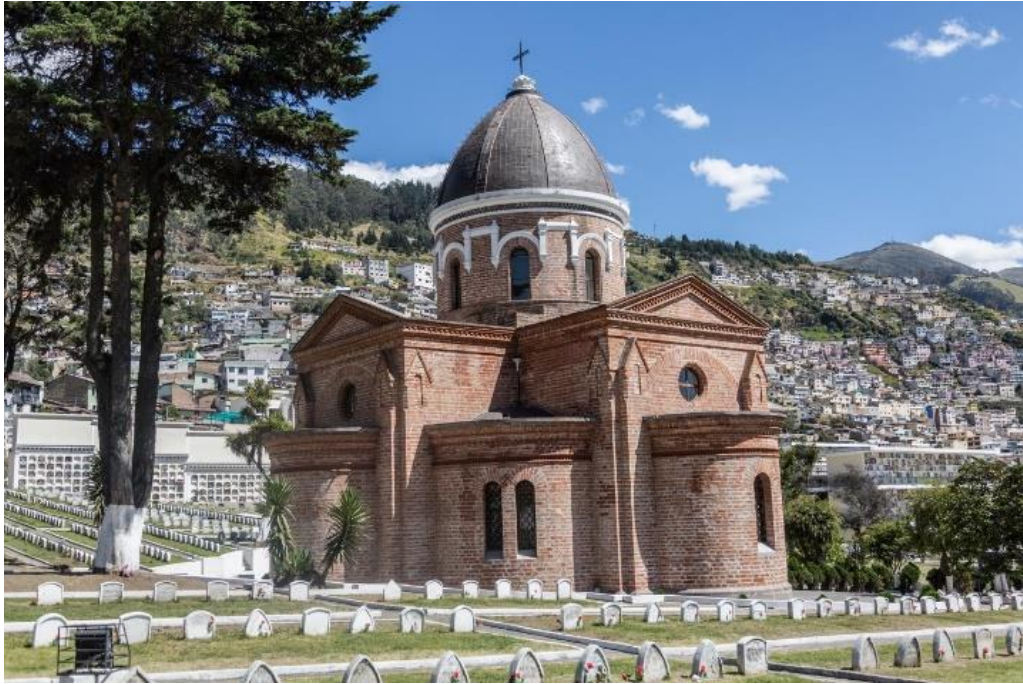
Figura 7: El cementerio de San Diego