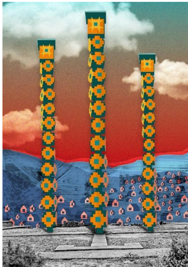
Figura 2: Propuesta Base Mitad del Mundo