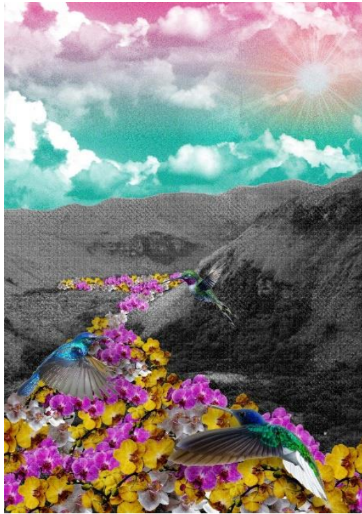
Figura 11: Propuesta base Quinde