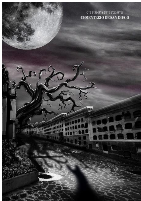
Figura 9: Propuesta final cementerio