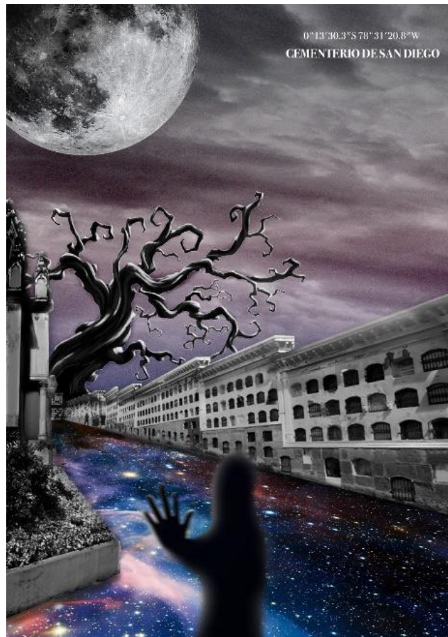
Figura 8: Propuesta base cementerio