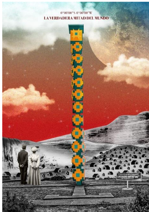
Figura 3: Propuesta final Mitad del Mundo