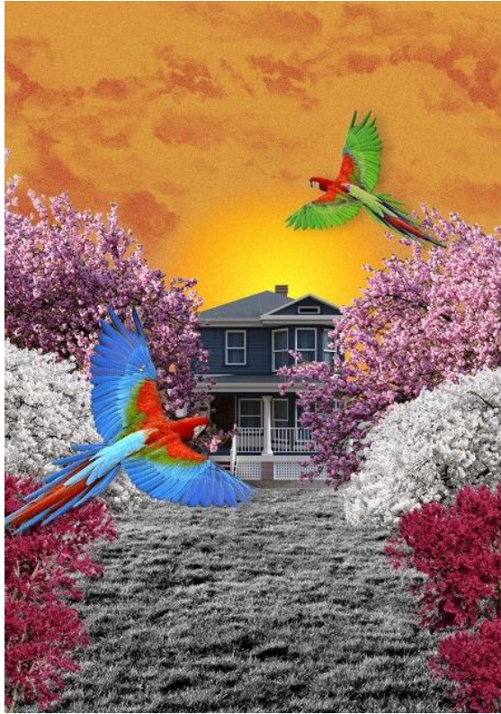
Figura 5: Propuesta base jardín Alado