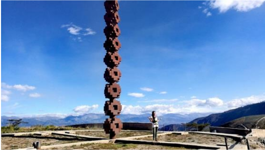
Figura 1: La verdadera Mitad del Mundo