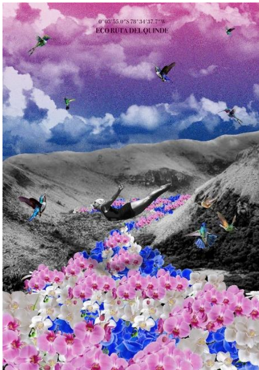
Figura 12: Propuesta final Quinde