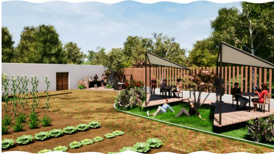
Figura 14. Render intervención en zona de talleres y actividades