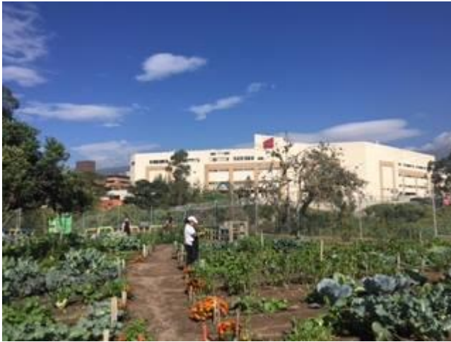
Figura 3. Fotografía del Huerto Vivero CC