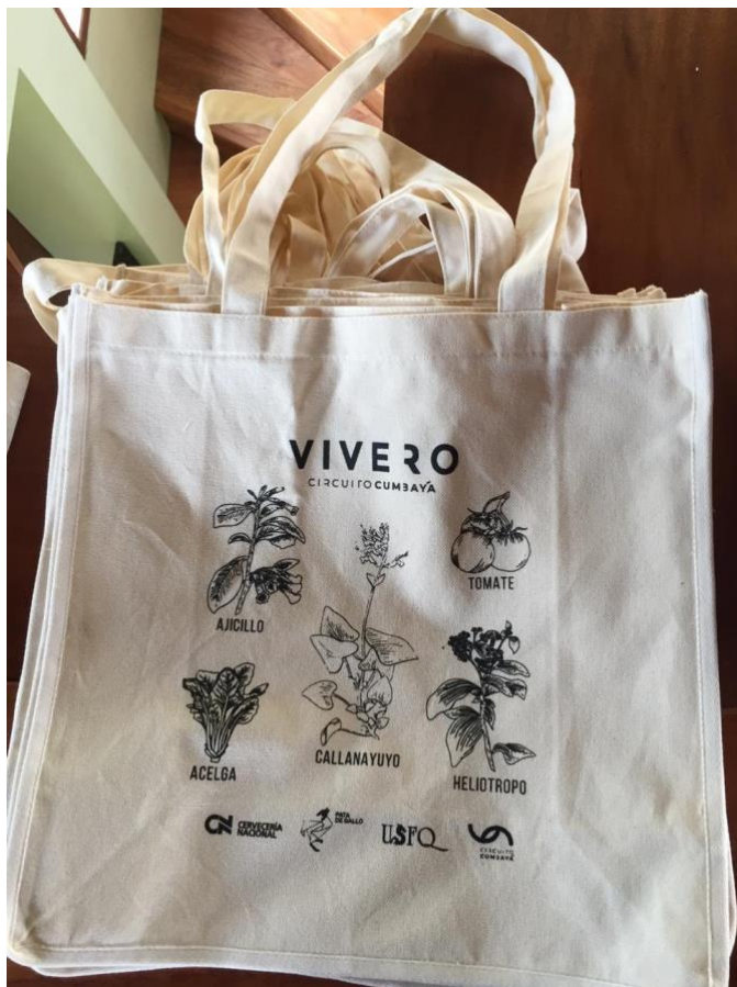
Figura 2. Bolsos de tela realizados para el Huerto Vivero CC

Note: The following document is available through Universidad San Francisco de Quito USFQ institutional repository. Nonetheless, this document – in whole or in part – should not be considered a publication. For further information see Discussion document on best practice for issues around theses publishing available on http://bit.ly/COPETheses .