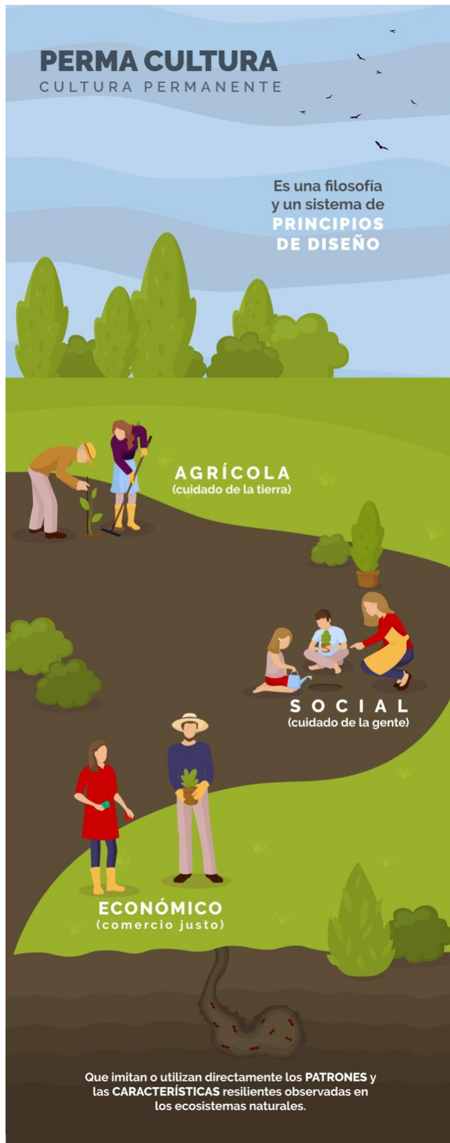
Figura 11. Vectorización de concepto de permacultura

Note: The following document is available through Universidad San Francisco de Quito USFQ institutional repository. Nonetheless, this document – in whole or in part – should not be considered a publication. For further information see Discussion document on best practice for issues around theses publishing available on http://bit.ly/COPETheses .