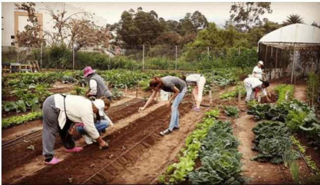
Figura 4. Personas del Huerto Vivero CC 1