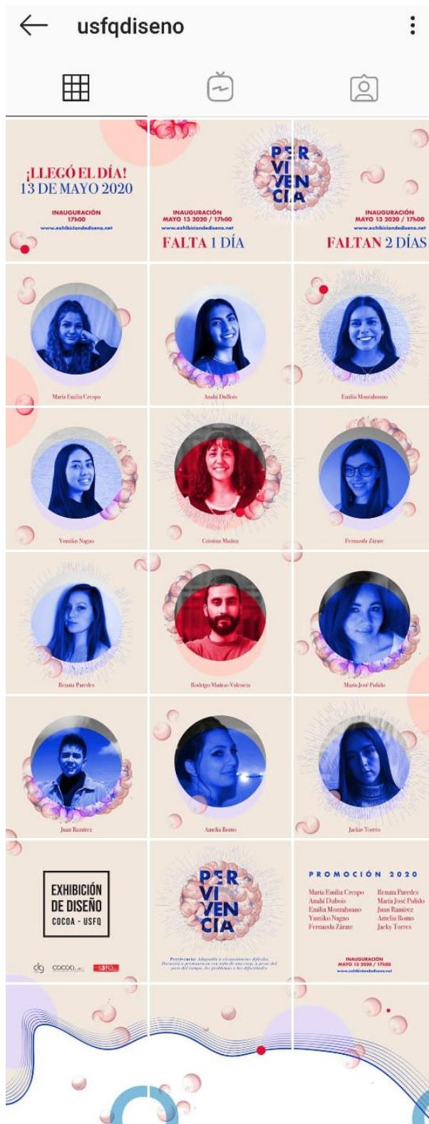
Figura 20. Campaña de expectativa para exhibición de “Pervivencia”

Note: The following document is available through Universidad San Francisco de Quito USFQ institutional repository. Nonetheless, this document – in whole or in part – should not be considered a publication. For further information see Discussion document on best practice for issues around theses publishing available on http://bit.ly/COPETheses .