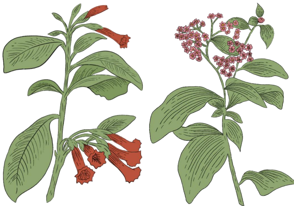
Figura 7. Ilustraciones de plantas nativas para la re-inauguración Huerto Vivero CC