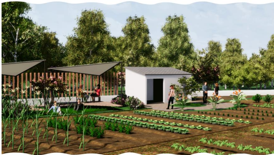
Figura 15. Render intervención en jardín botánico y bodega