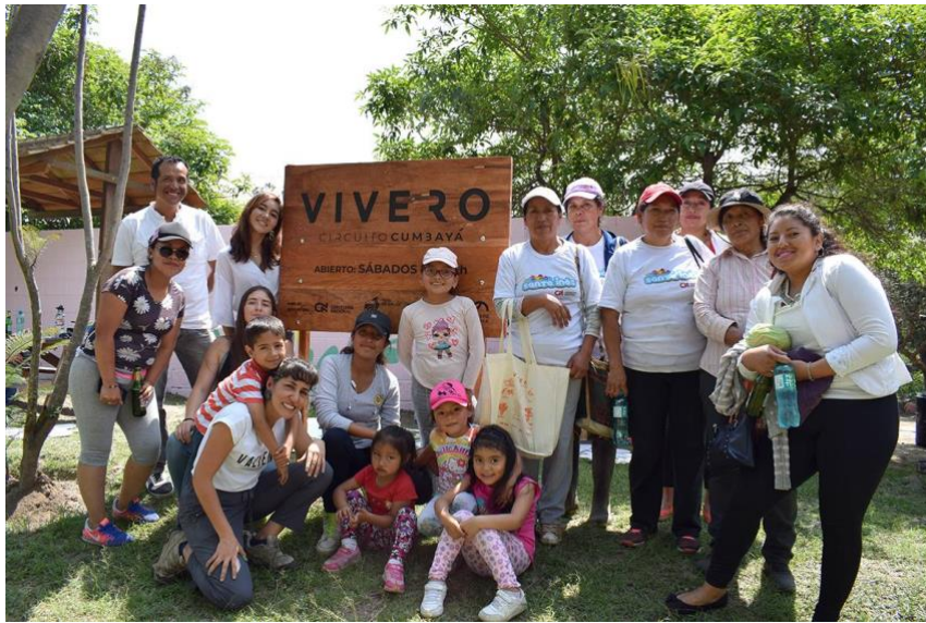
Figura 1. Inauguración del Huerto Vivero CC