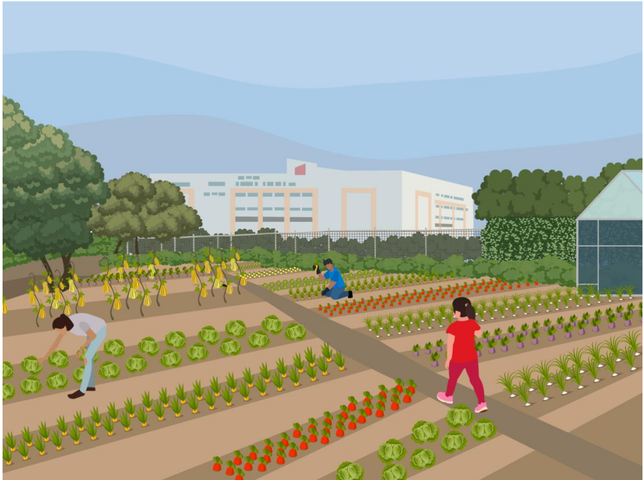
Figura 6. Vectorización de las fotografías del Huerto Vivero CC

Note: The following document is available through Universidad San Francisco de Quito USFQ institutional repository. Nonetheless, this document – in whole or in part – should not be considered a publication. For further information see Discussion document on best practice for issues around theses publishing available on http://bit.ly/COPETheses .