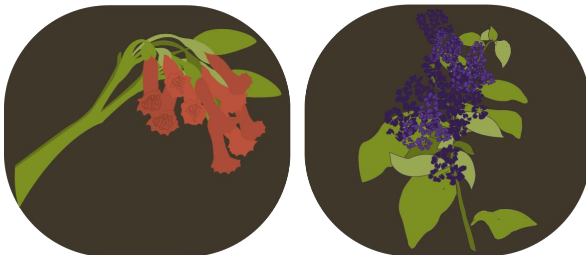
Figura 8. Ilustraciones de plantas nativas adaptadas a la gráfica del proyecto

Note: The following document is available through Universidad San Francisco de Quito USFQ institutional repository. Nonetheless, this document – in whole or in part – should not be considered a publication. For further information see Discussion document on best practice for issues around theses publishing available on http://bit.ly/COPETheses .