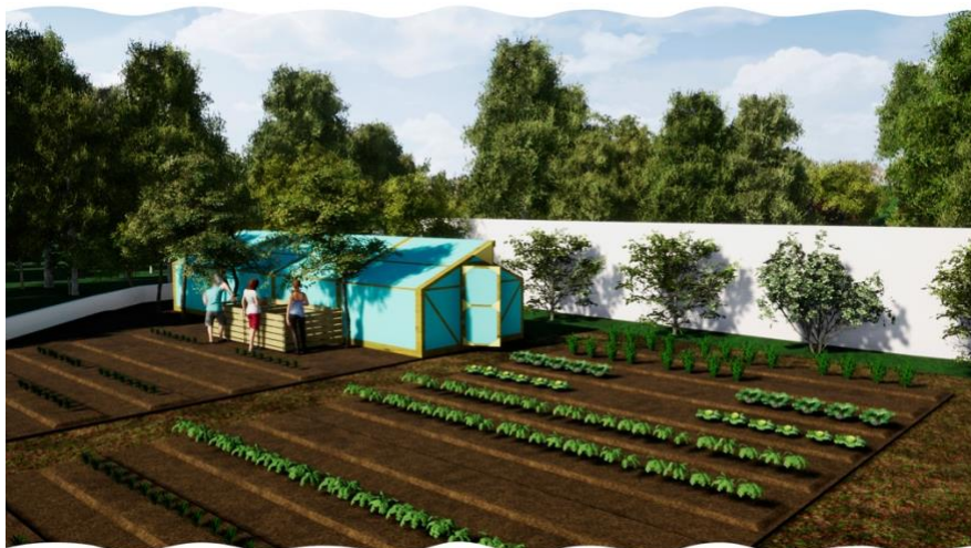
Figura 16. Render intervención en compostaje e invernadero

Note: The following document is available through Universidad San Francisco de Quito USFQ institutional repository. Nonetheless, this document – in whole or in part – should not be considered a publication. For further information see Discussion document on best practice for issues around theses publishing available on http://bit.ly/COPETHeses .