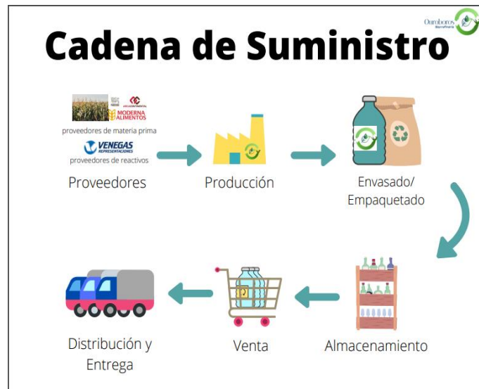
Figura 3: Diagrama de la cadena de suministro de Ouroboros. Obtenido en Canva. Elaboración propia.