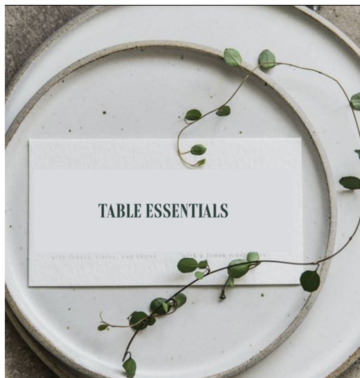
Anexo 5: Logo