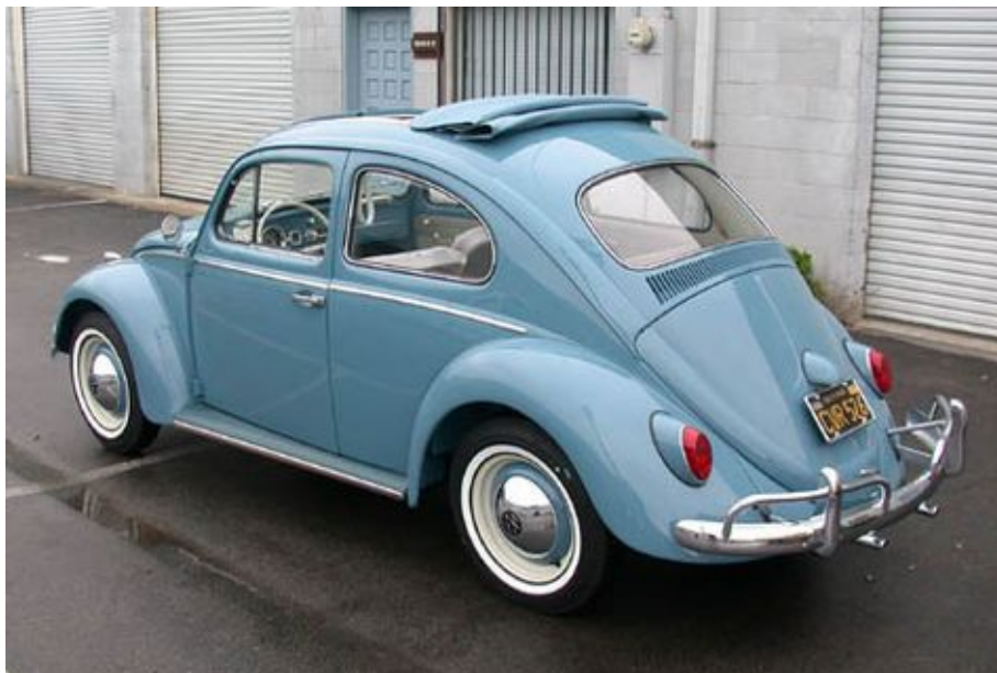
Figura 15. Pichirilo celeste

El final de la primera serie se desarrolla en el interior de un antiguo pichirilo celeste, un regalo de la madre de los hermanos para Elena, quien lo atesora como su primer vehículo. Los demás capítulos de la serie se desarrollan principalmente en el pichirilo.