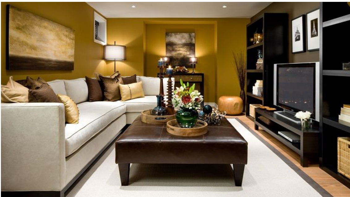
Figura 9. Sala TV Enrique De La Torre

La sala de la televisión de la casa de Enrique De La Torre, a diferencia del resto de lugares de la casa, es un poco más moderna, con muebles más vanguardistas, no cuenta con muchos adornos y hay presencia de bastante tecnología.