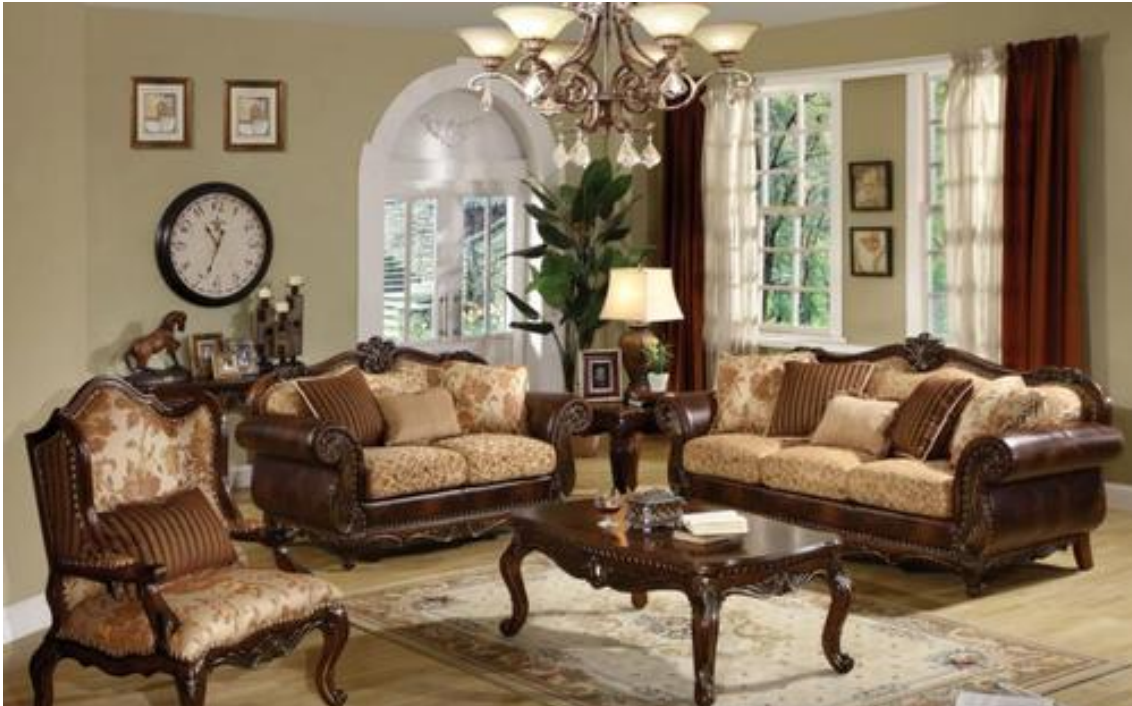
Figura 8. Sala Enrique De La Torre