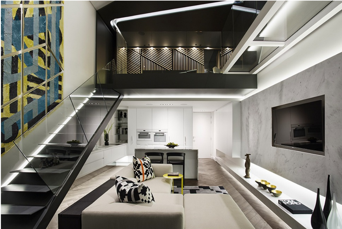
Figura 14. Departamento Felipe De La Torre