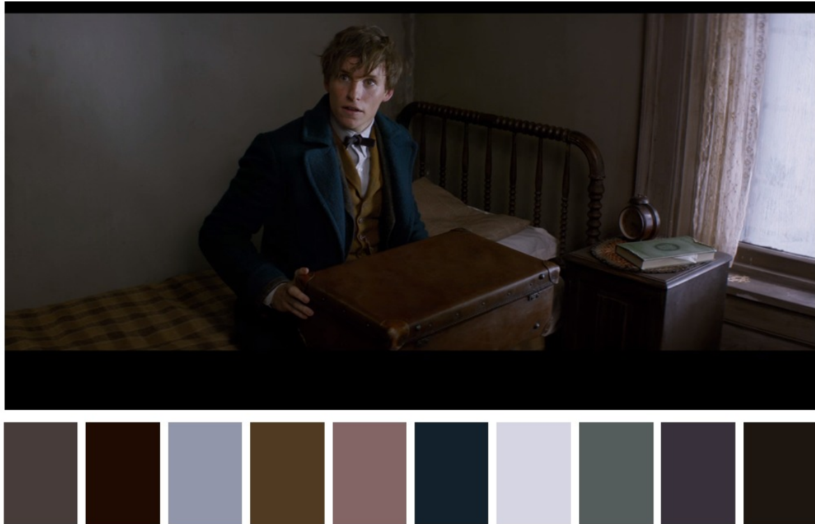
Figura 4. Paleta de colores oscuros

La paleta de colores oscuros será tomada como referencia para resaltar los tonos fríos en las escenas dentro de la casa de Enrique De La Torre, donde transcurre el funeral y la lectura del testamento. Los colores son opacos, generando un contraste entre la luz difusa fría y los elementos dentro de la misma casa.