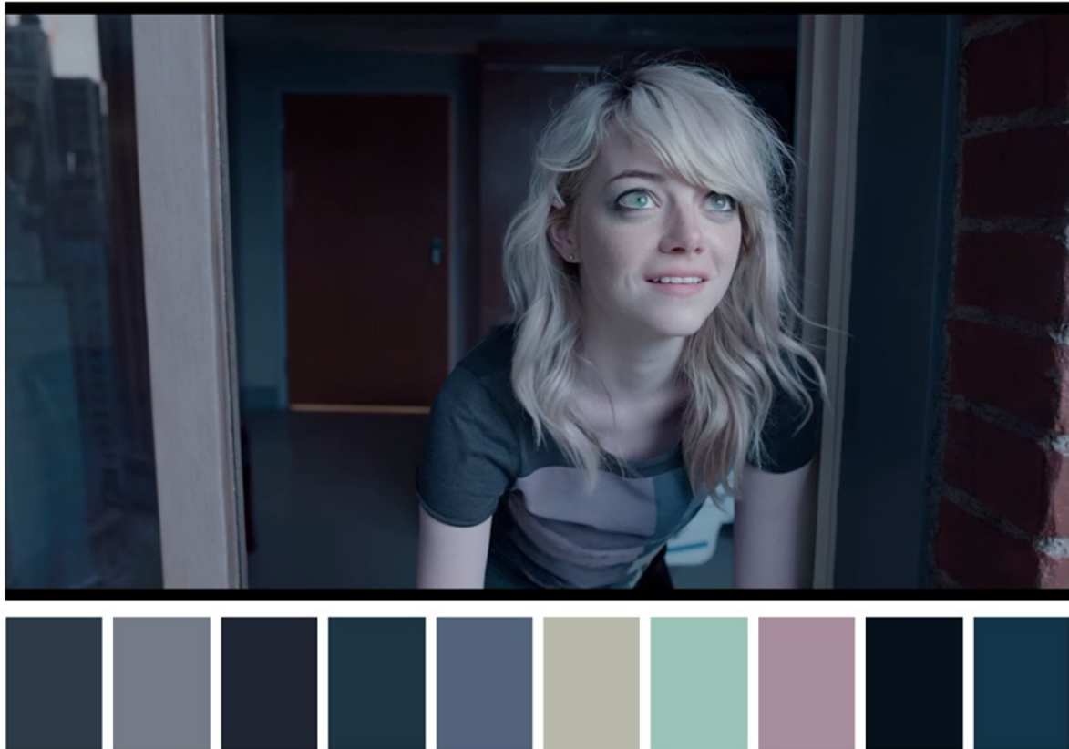
Figura 5. Paleta de colores exteriores

La paleta de colores exteriores será tomada como referencia para las escenas que ocurren en el exterior de la casa de Enrique De La Torre. Estas escenas ocurren por la tarde y son momentos donde los protagonistas exponen sus problemas individuales y, con estos colores, se pretende que el espectador sienta una cercanía e identificación con cada uno.