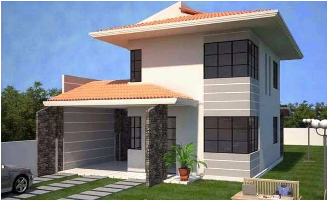
Figura 13. Casa Miguel De La Torre

La casa de Miguel De La Torre es una casa de un tamaño bastante grande ya que alberga una familia de cuatro con dos adolescentes. Es moderna sin llegar a ser muy vanguardista. En este lugar sí podemos ver el interior de la casa, sobre todo la habitación de Miguel y la sala. En esta casa suceden algunas escenas que pretenden generar angustia al observador por la situación que vive Miguel.