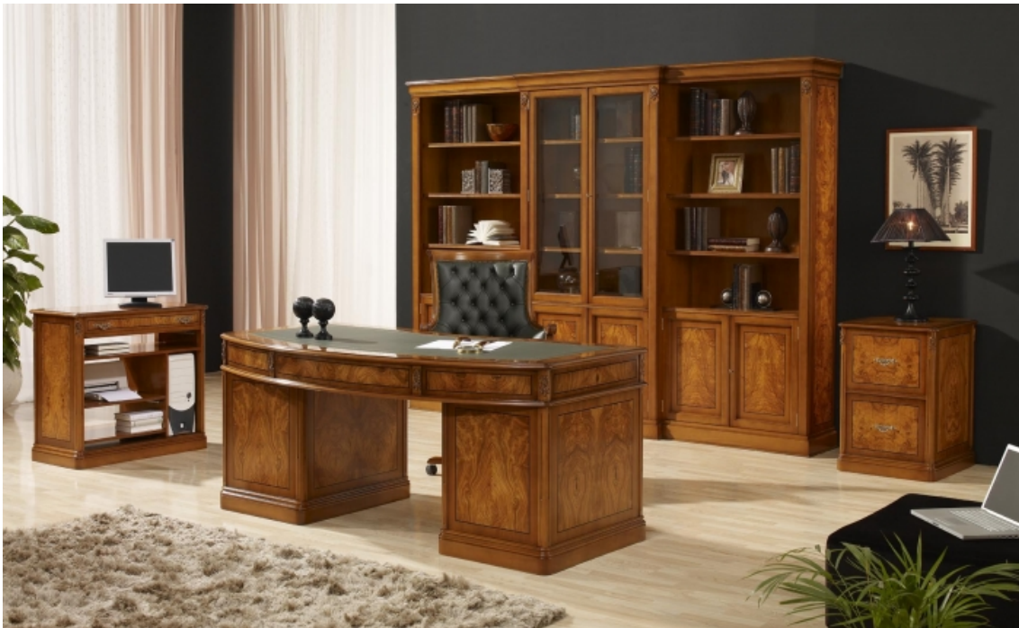
Figura 10. Oficina Enrique De La Torre

La oficina de Enrique De La Torre es un lugar crucial a lo largo de la serie ya que en este sitio se llevan a cabo las conversaciones con el abogado y se llegan a puntos específicos que determinarán el futuro de los personajes principales. Este es un lugar amplio, todos los muebles son de madera y no hay muchas decoraciones. Hay una estantería de libros en la pared principal y al frente hay un escritorio con una silla giratoria. Hay pocas plantas y alfombras en distintas partes del suelo.