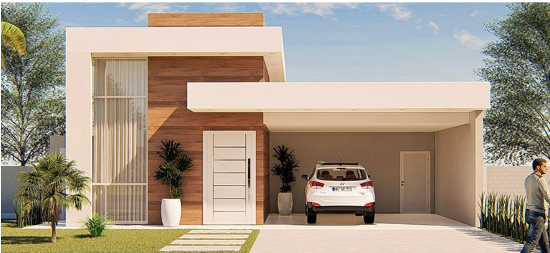
Figura 12. Casa Elena De La Torre

La casa de Elena De La Torre es un lugar que únicamente conocemos por fuera ya que por su divorcio es el sitio en el que menos quiere estar. Es una casa pequeña pero muy moderna ya que es arquitecta y ella la diseñó.